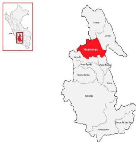
Figura 1, 2 y 3 Coordenadas geográficas son las siguientes. Latitud: 13° 08' sur, Longitud: 74° 13' Oeste y Altitud: 2772 msnm

El experimento se llevó a cabo a campo abierto en un terreno aledaño a la estación meteorológica de la Universidad Nacional de San Cristóbal de Huamanga-Ayacucho, cuyas coordenadas geográficas son: 13° 08' Latitud Sur, 74° 13' Longitud Oeste, 2772 m.s.n.m. según el Servicio Nacional de Meteorología e Hidrología (SENAMHI-Perú). Fig. 1, 2, 3, 4, y 5.